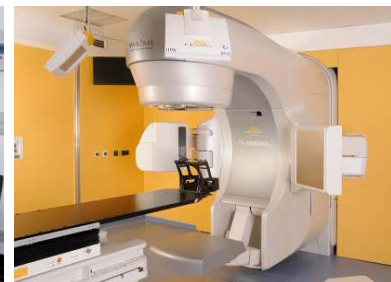
Modernste Technik – Im Städtischen Klinikum Dessau kommt die neueste Generation der Bestrahlungstechnologie zum Einsatz.