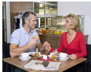
Klinikkomfort auf Hotelniveau: Die Hotelstation des Städtischen Klinikums Dessau bietet den Patienten als Wahlleistung modernes Ambiente mit Serviceplus.